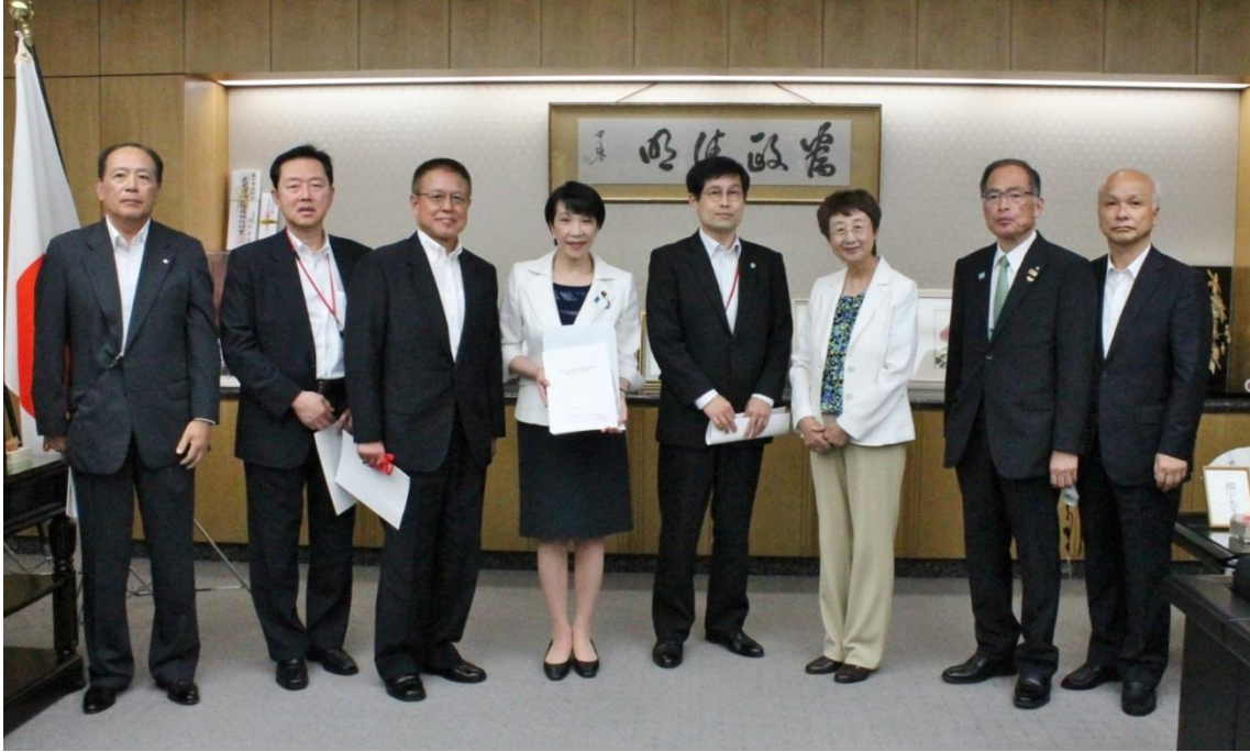
提言書を受け取る高市総務大臣