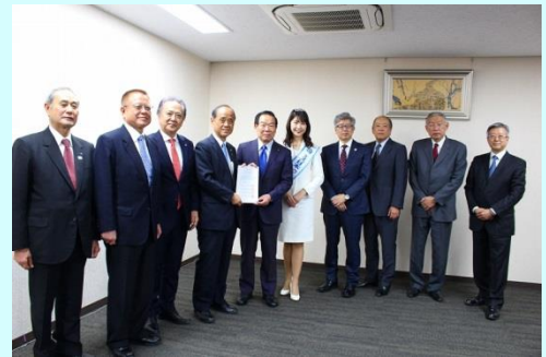
提言書を受け取る 額賀自由民主党下水道事業促進議員連盟会長