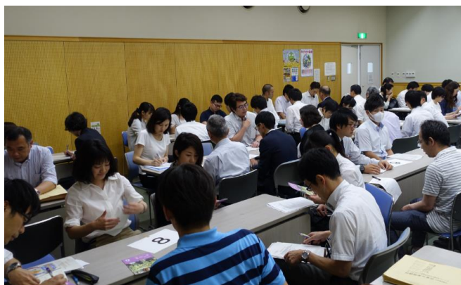
参加者交流の時間